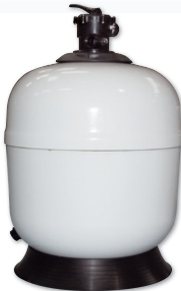
RTM Classique Top 610-A