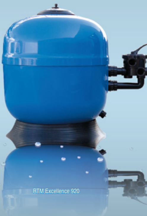
RTM Excellence 920