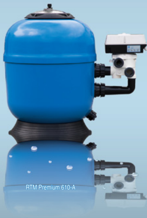
RTM Premium 610-A

PREMIUM, EXCELLENCE OU CLASSIQUE, une gamme pour tout simplifier.