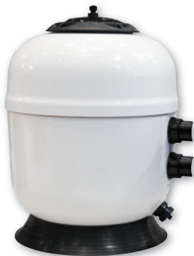
RTM Classique Side 760