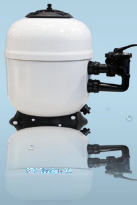
RTM Classique 760