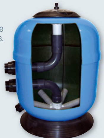
Vue en coupe d'un filtre RTM Excellence 760