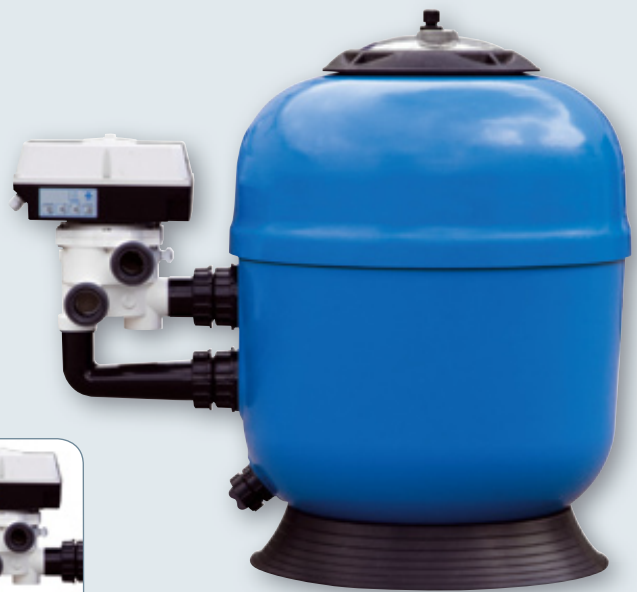
RTM Premium 610-A

Vanne 6 voies automatique Easy 4000 avec horloge et pressostat