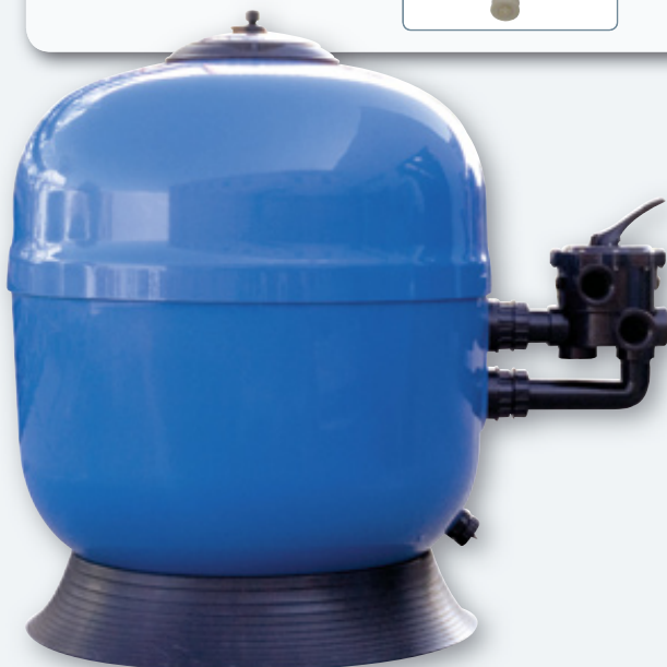
RTM Excellence 920

Vanne multivoies fournie avec ses raccords collés.